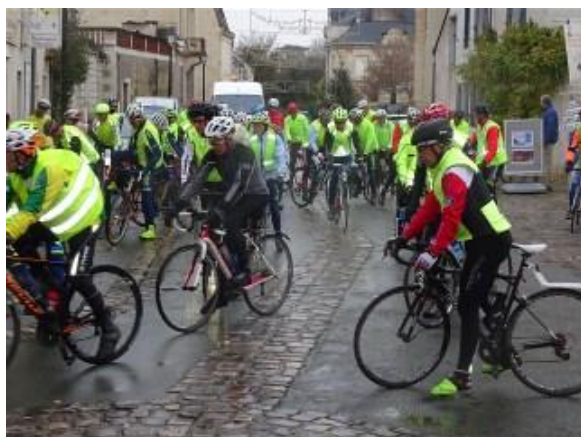
Le peloton de 49 cyclos à St Rémy la Varenne

Devant l'insistance de certaines personnes mal intentionnées (lol), je suis rentré au CA en 2014 et je m'occupe des vêtements (j'ai pris le risque de remplacer la figure mondialement connue de tous --> René à qui je rends un hommage appuyé pour son travail réalisé pendant de nombreuses années)